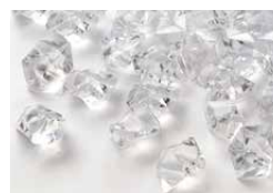
Cristaux en acrylique