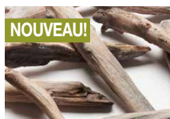
Bois de grève réaliste