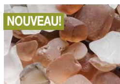
Éclats de verre