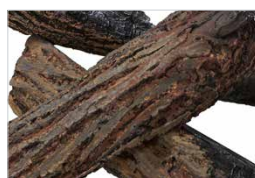
Bûches au rougeoiement rythmique