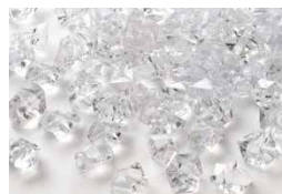
Cristaux en acrylique