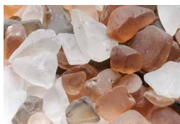
Éclats de verre