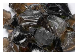
Bûches carbonisées réalistes