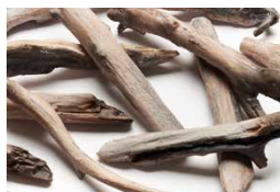
Bois de grève réaliste