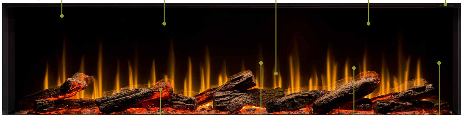
Tableau de commande à trois boutons

Bûches déplaçables à connexion rapide avec braises en éclats de verre