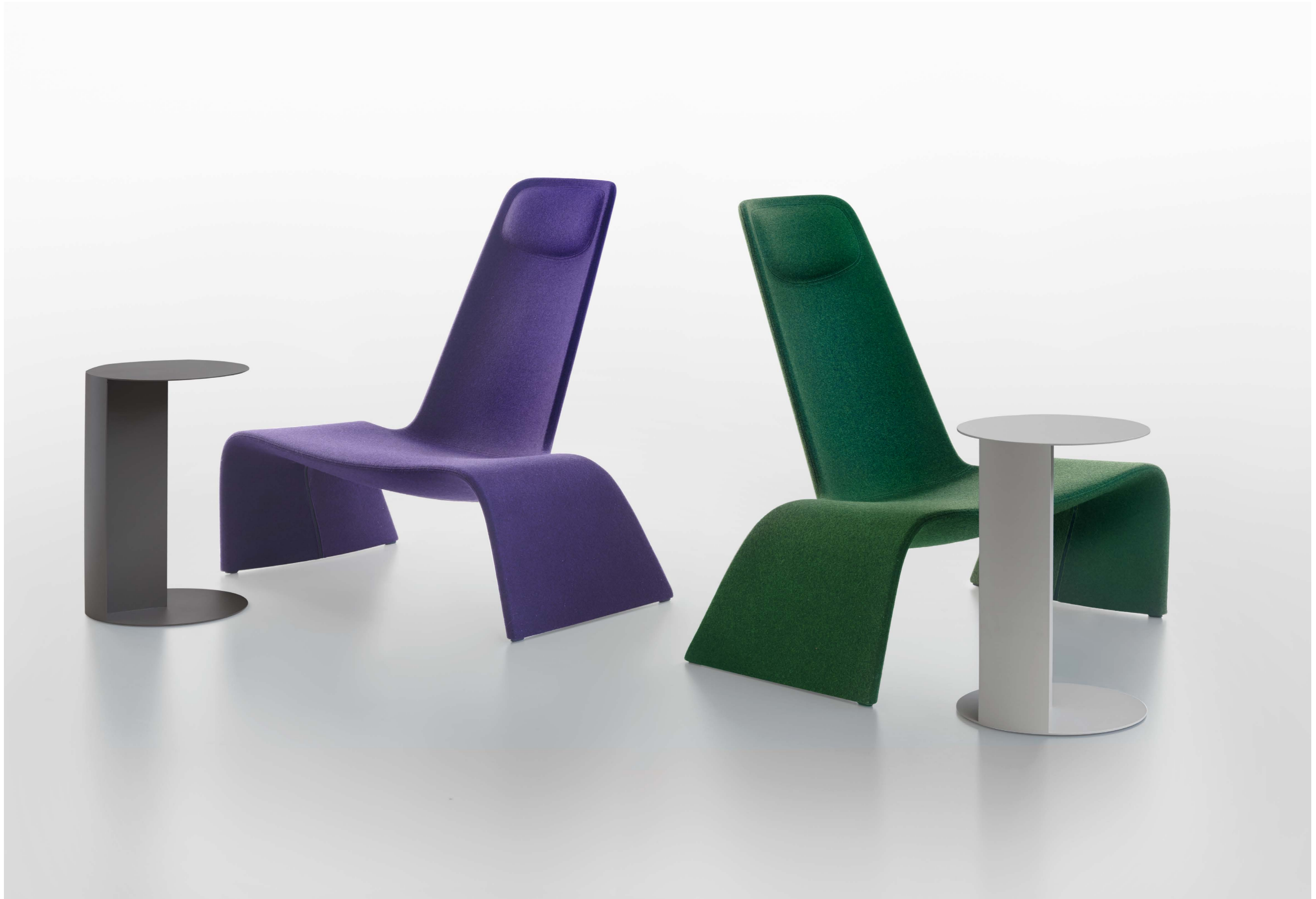
TO side table with LAND lounge chair, upholstered