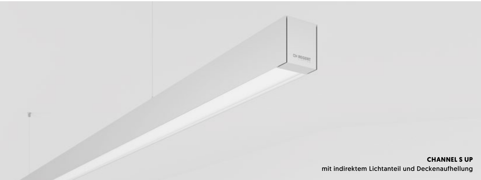
CHANNEL S UP mit indirektem Lichtanteil und Deckenaufhellung