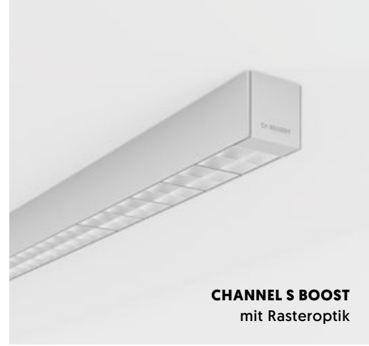
CHANNEL S BOOST mit Rasteroptik