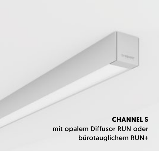
CHANNEL S mit opalem Diffusor RUN oder bürotauglichem RUN+