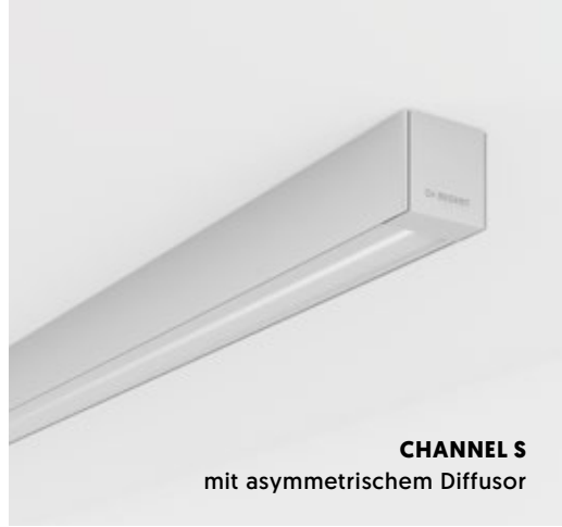
CHANNEL S mit asymmetrischem Diffusor