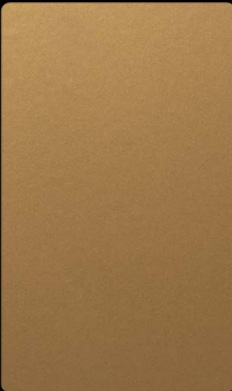
Anodic Gold AE20111000820