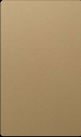
Anodic Champagne AE20101000220

TR Anodic Collection, popüler olan anodik tonlarını yakından takip eden bir renk serisidir ve standart eloksallı kaplamanın etkisini sunar. Bu seri, toz boya ile ilgili tüm avantajlara sahiptir ve Alesta® AP kalitesinde mevcuttur. Dikkat çekici bu koleksiyon, seçtiğiniz anodik efekt renginde hızlı ve düşük maliyetli sonuç sağlar ve Qualicoat Class I ve GSB sertifikalarının her ikisine de sahiptir.