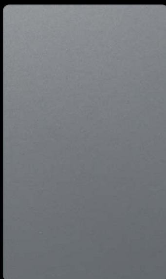
Anodic Sapphire AE20105000520