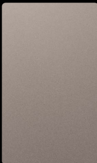
Anodic Natura AE20107000120