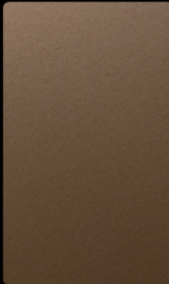
Anodic Bronze AE20108000320