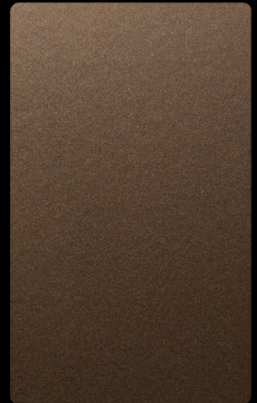
Anodic Brown AE20108000420