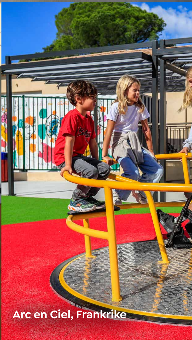
Arc en Ciel, Frankrike