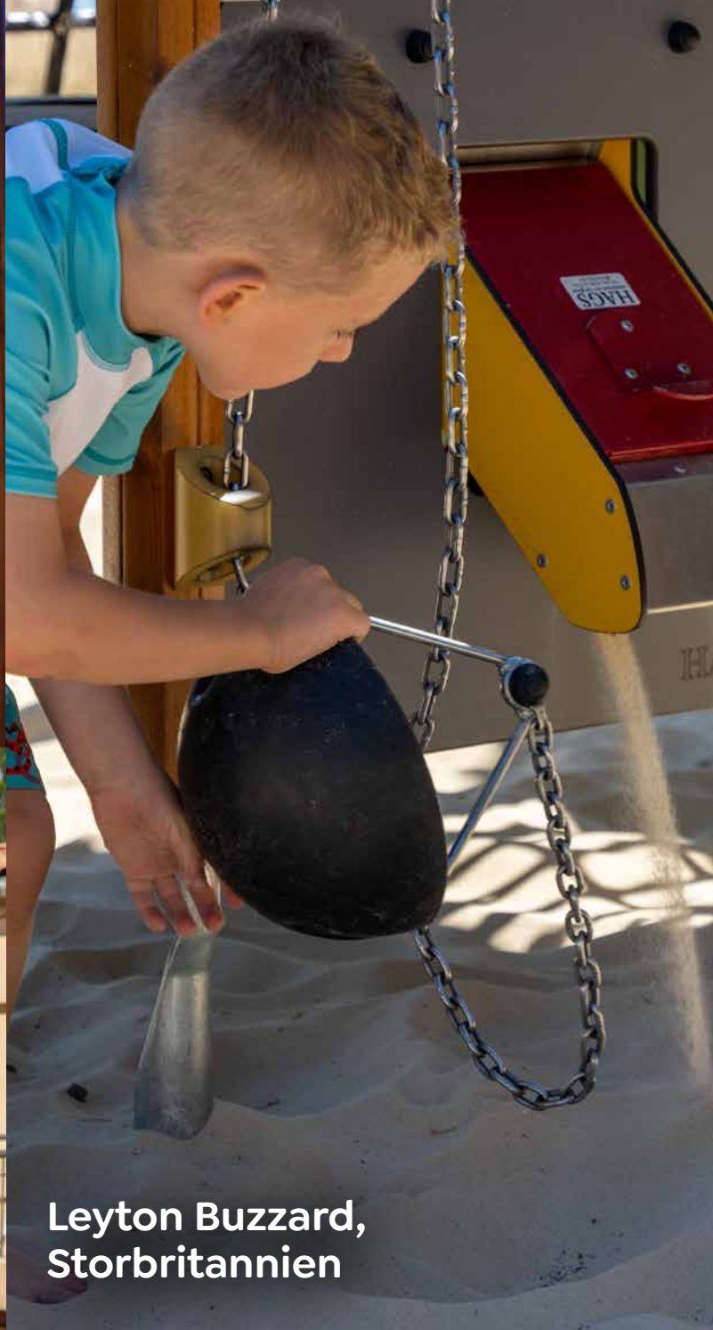
Leyton Buzzard, Storbritannien