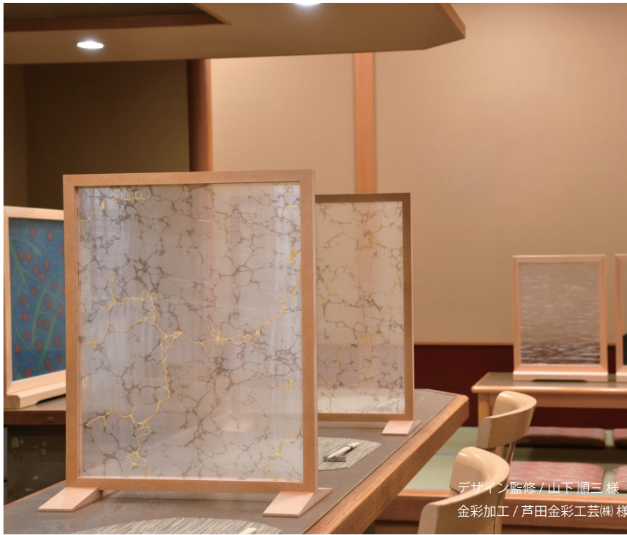
デザイン監修/山下順三様 金彩加工/芦田金彩工芸(株)様