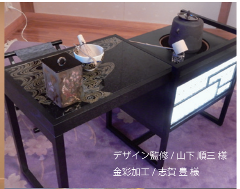
デザイン監修/山下順三様 金彩加工/志賀豊様