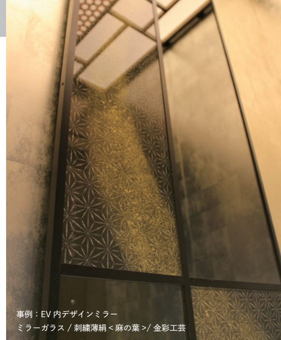
事例：EV 内デザインミラー ミラーガラス / 刺繍薄絹 < 麻の葉 > / 金彩工芸