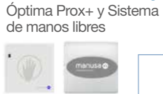
Óptima Prox+ y Sistema de manos libres