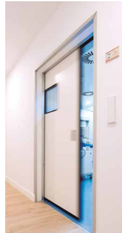
Puertas herméticas correderas. Área quirúrgica hospitalaria.

Todo el conjunto de la puerta está diseñado para garantizar la higiene: mirilla enrasada, manillón, marco bloc.