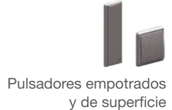
Pulsadores empotrados y de superficie