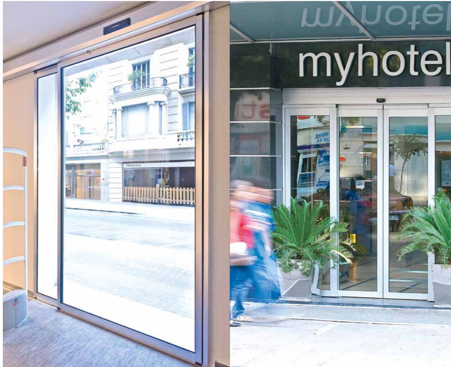
Corredera lateral con hoja enmarcada. Sector comercio.