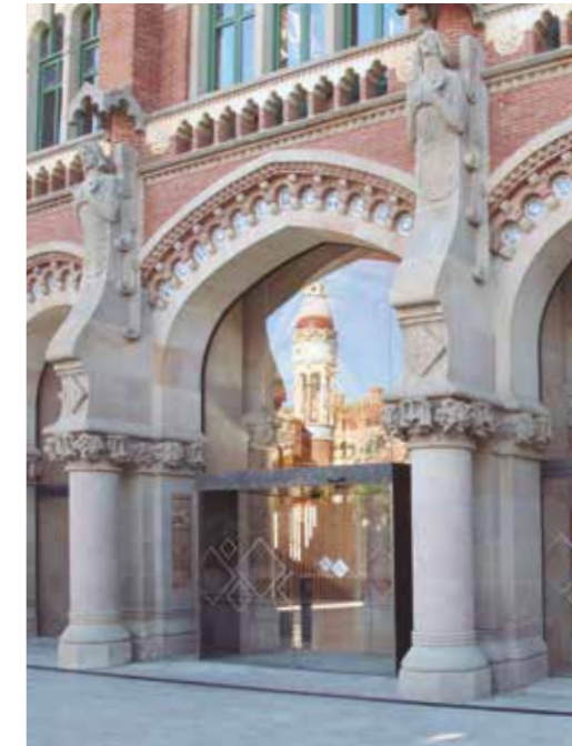
Puerta automática de apertura lateral. Sector museos.