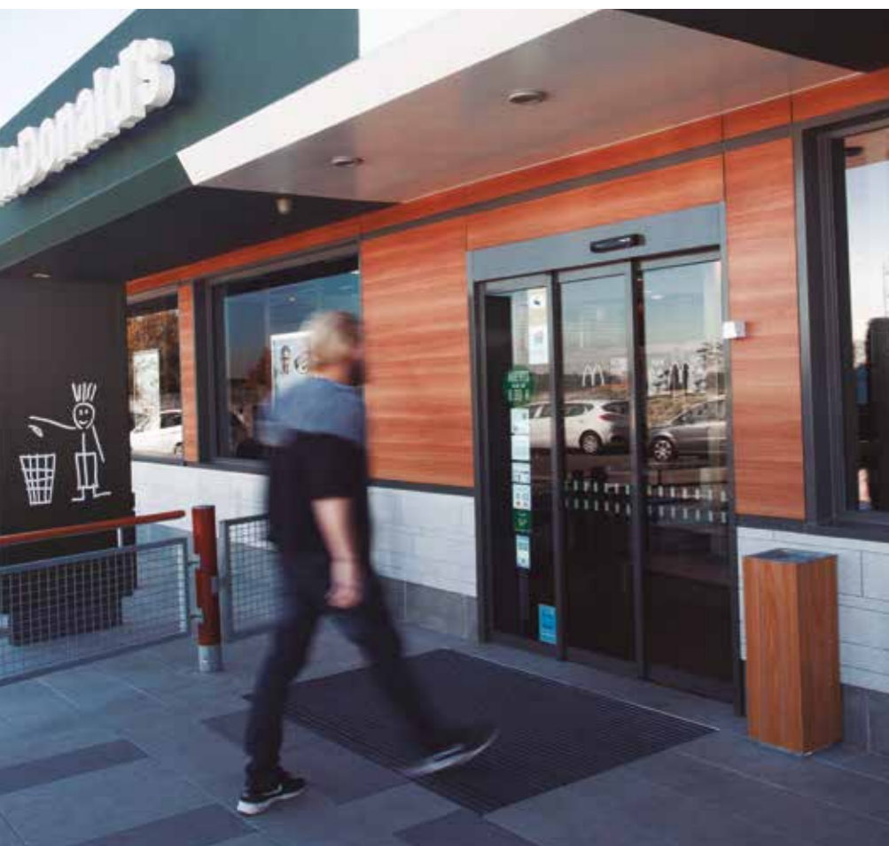
Puertas automáticas de apertura telescópica. Sector restauración.

Son ideales para entradas con limitaciones de espacio, para separaciones de corredores, o donde se requiera una amplitud de paso libre mayor de la habitual, como por ejemplo concesionarios de automóviles.