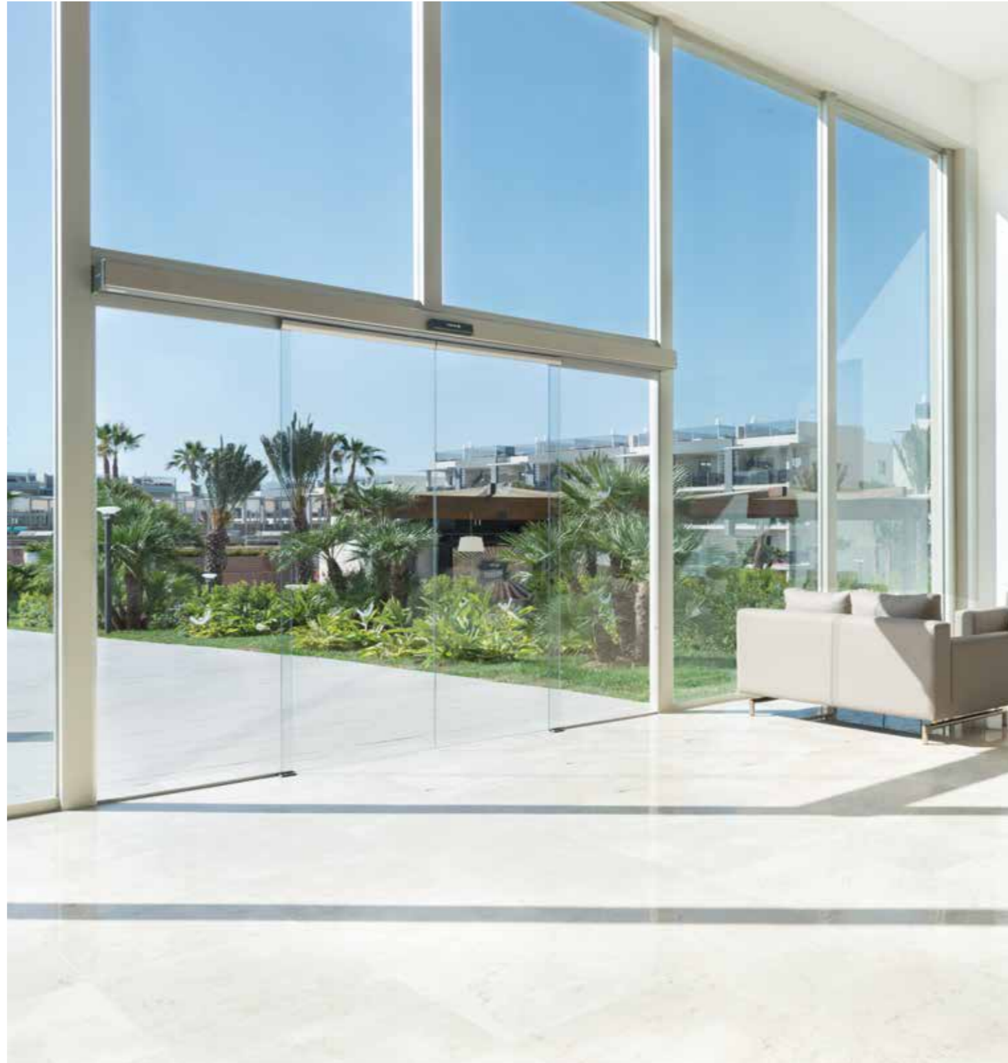
Puerta automática de apertura central. Sector hotelero.

Las puertas correderas centrales y laterales Manusa ofrecen la máxima velocidad de apertura del mercado, junto con la máxima seguridad. Son recomendables en entradas y salidas públicas donde la circulación de personas sea intensa o donde la seguridad de los usuarios esté vinculada a la fluidez del tráfico.