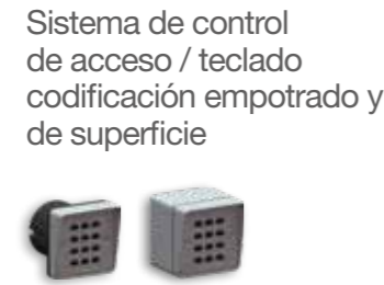
Sistema de control de acceso / teclado codificación empotrado y de superficie