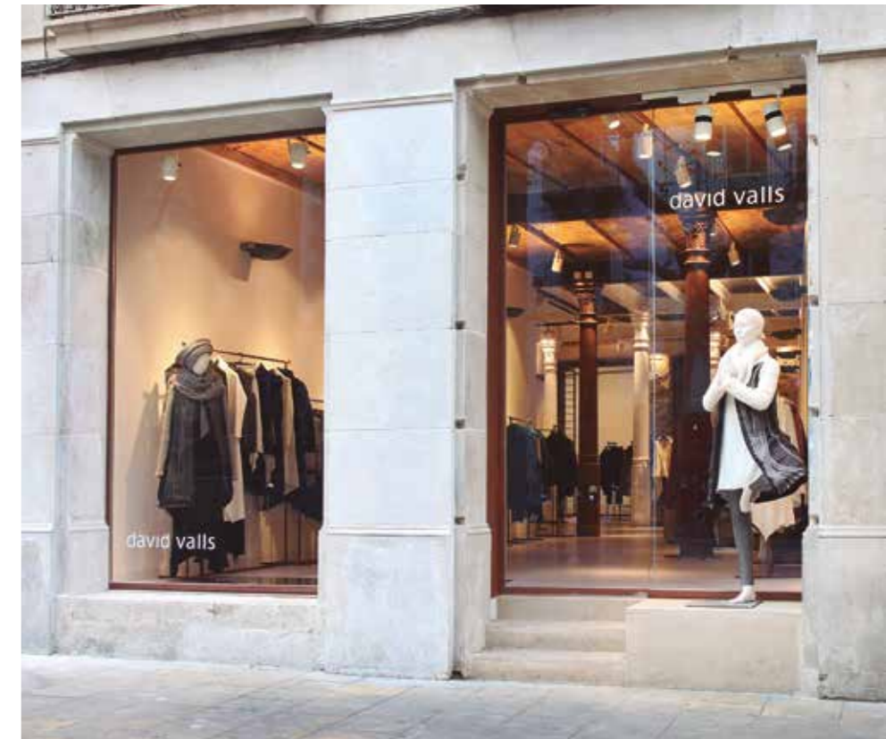
Puerta automática de apertura lateral. Sector comercio.