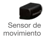
Sensor de movimiento