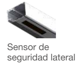
Sensor de seguridad lateral

- Otros accesorios disponibles. - Consultar necesidades con departamento comercial.