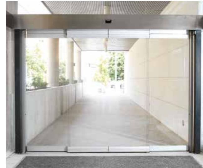
Puerta antipánico con hojas sin perfilera vertical. Sector centros comerciales.

La puerta funciona en modo normal (corredera y automática). En caso de emergencia, las hojas se abaten por simple empuje manual hacia el exterior y se repliegan en los laterales, para permitir un amplio paso libre de evacuación.