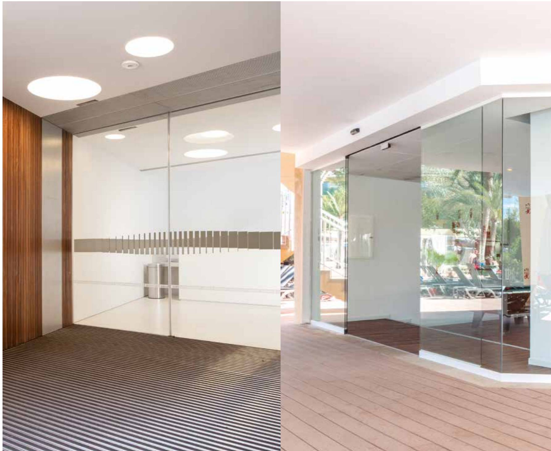
Puerta apertura lateral con hojas totalmente transparentes, opción plinto oculto. Sector museos.