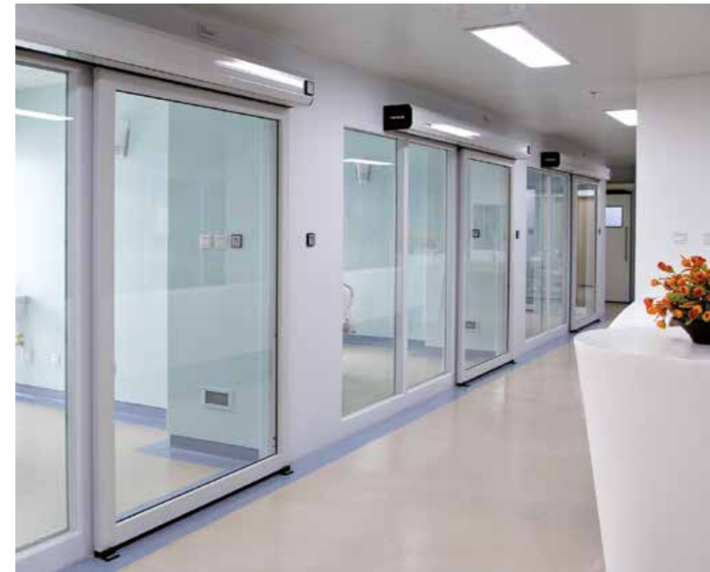
Puertas herméticas acristaladas Clear View. Unidad de vigilancia intensiva hospitalaria.