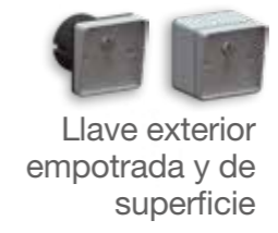
Llave exterior empotrada y de superficie