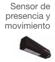
Sensor de presencia y movimiento