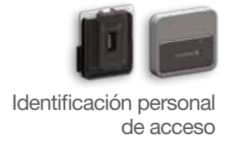
Identificación personal de acceso