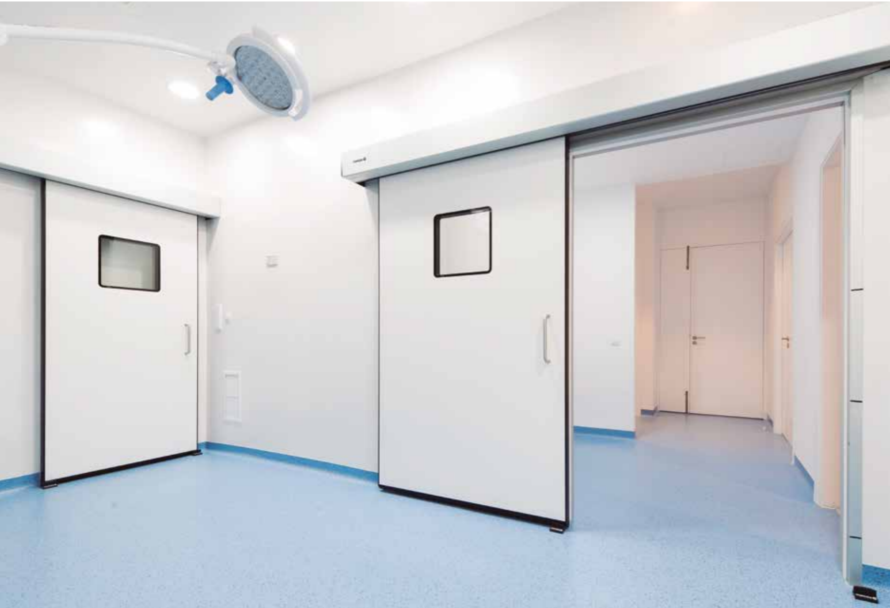
Puertas herméticas correderas. Área quirúrgica hospitalaria.

Las puertas herméticas Manusa aúnan las ventajas de una puerta automática con la hermeticidad e higiene requeridas en ambientes limpios.