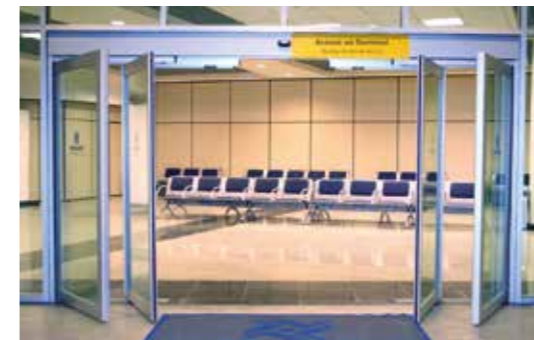
Puerta antipánico con hojas enmarcadas. Sector aeropuertos.

Sistema antipánico con hojas enmarcadas (A45-S4): las hojas correderas y abatibles completamente enmarcadas con carpintería de 45 mm ofrecen gran resistencia y durabilidad, y las hacen aptas para entradas de tráfico intenso.