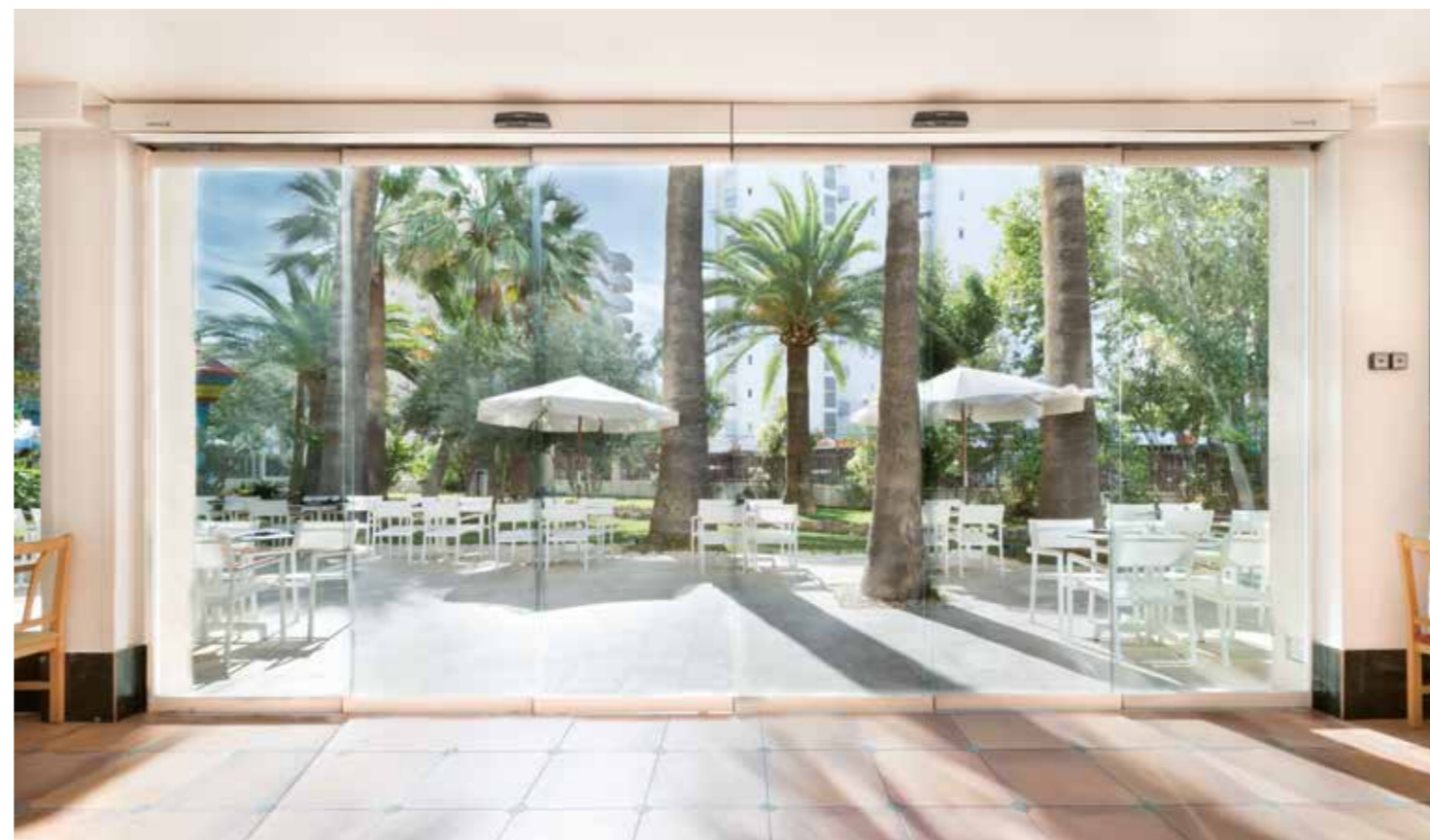
Puertas automáticas de apertura telescópica. Sector hotelero.

Puerta corredera de 2 hojas móviles que se desplazan lateralmente. Las hojas móviles se repliegan unas sobre otras para liberar el máximo espacio de paso en uno de los laterales de la puerta.