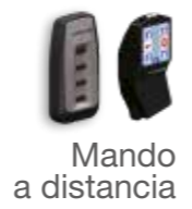
Mando a distancia