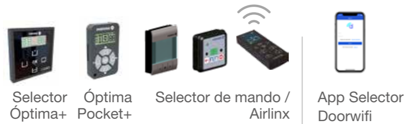
Selector Óptima+ Óptima Pocket+ Selector de mando / Airlinx App Selector Doorwifi

Integración y control remoto: Interface / Openlinx Manulink