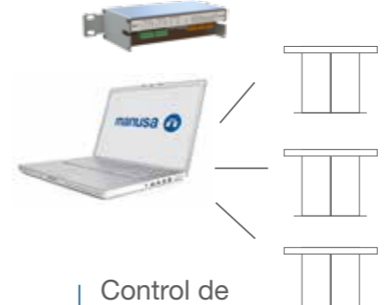
Control de afluencia

Integración y control remoto: Interface / Openlinx Manulink