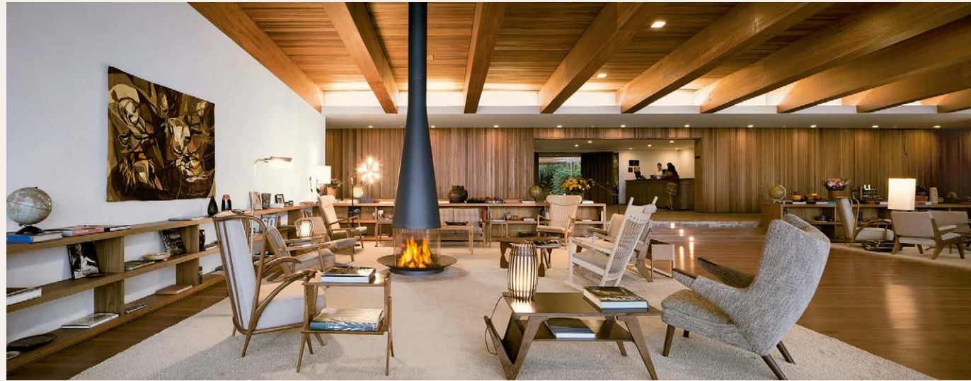
FILIOFOCUS Fasano Boa Vista / Brésil 🔥🔥