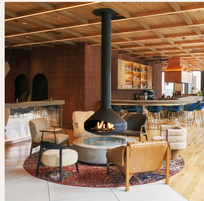
THE KNOT Sapporo / Japon