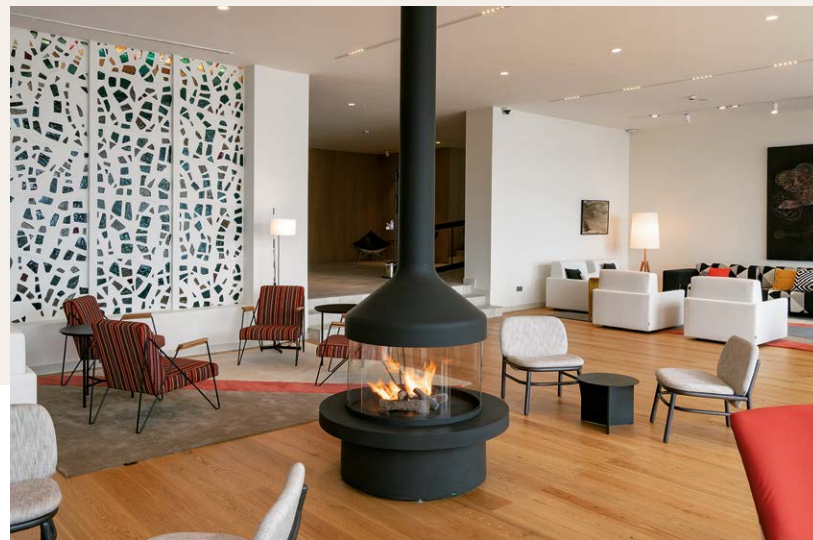
MEIJIFOCUS Parador de Aiguablava / Espagne 🔥