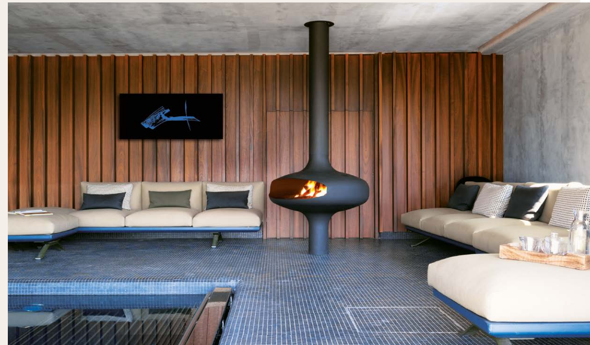
MAGMAFOCUS Son Brull / Espagne 🔥