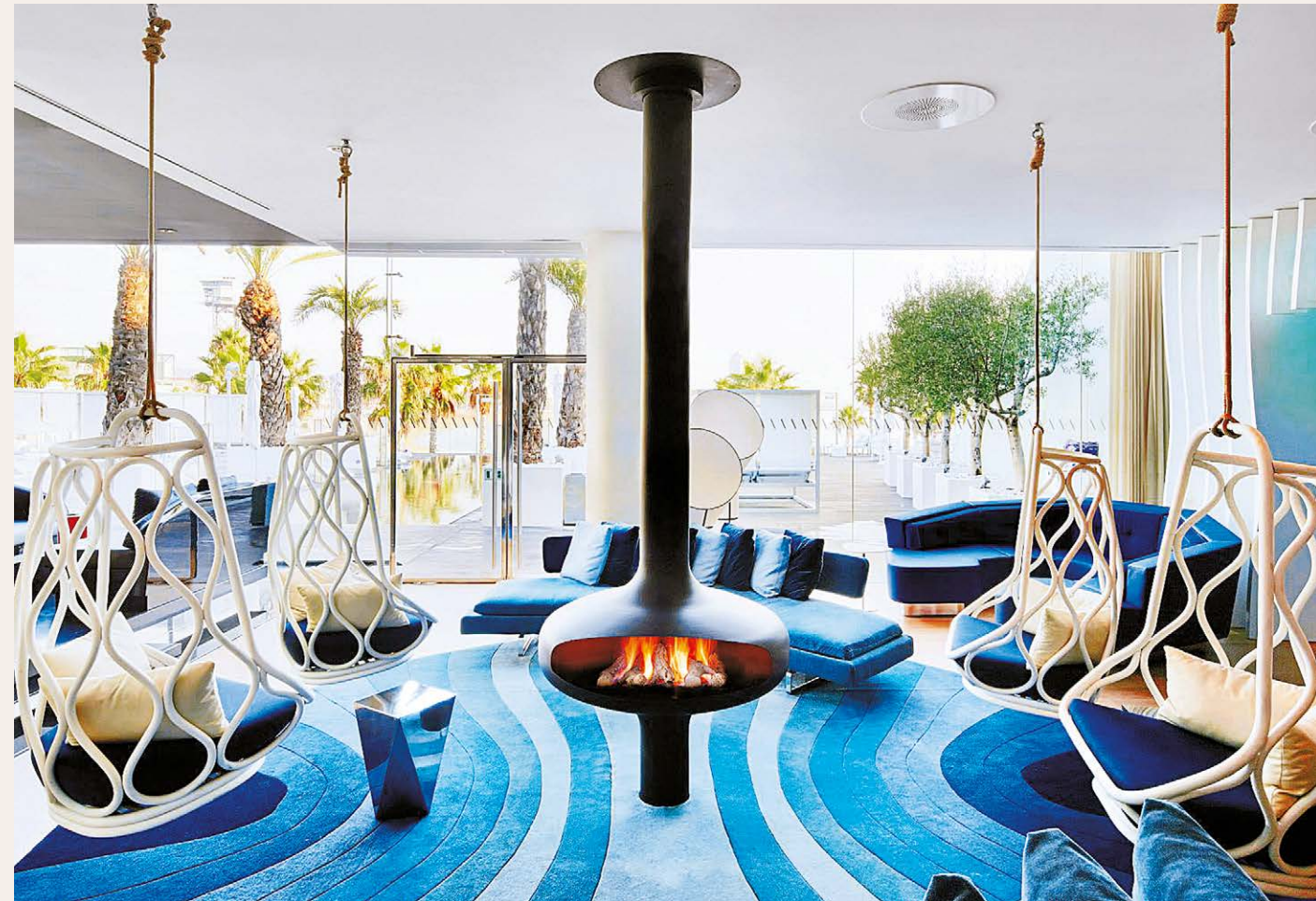
MAGMAFOCUS W Barcelona / Espagne 🔥