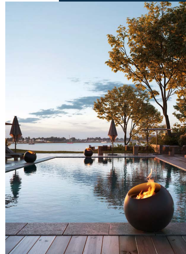
design ©christophe ploye - 2019