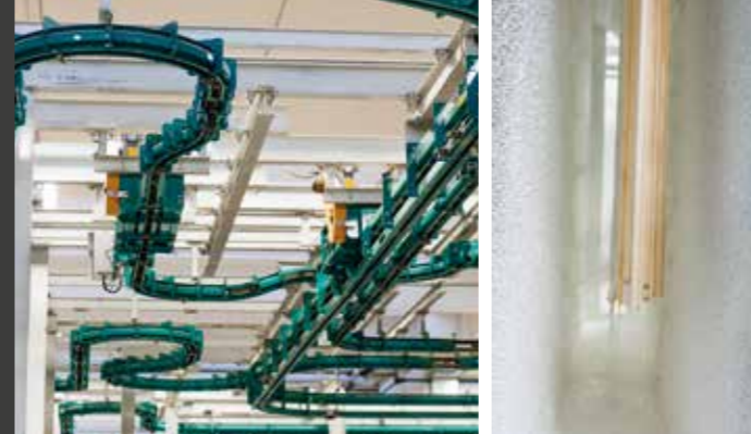
Reparto legno verniciatura | Wood painting department

Our production lines guarantee the quality, customization, speed, and maximum attention to customer needs, putting in place all the skills and synergies necessary to obtain a unique and customizable product. Excellence in the window production sector.