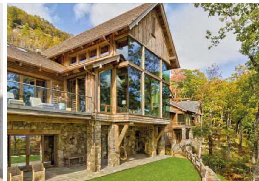
▲ Infissi composti ad angolo Compound corner windows