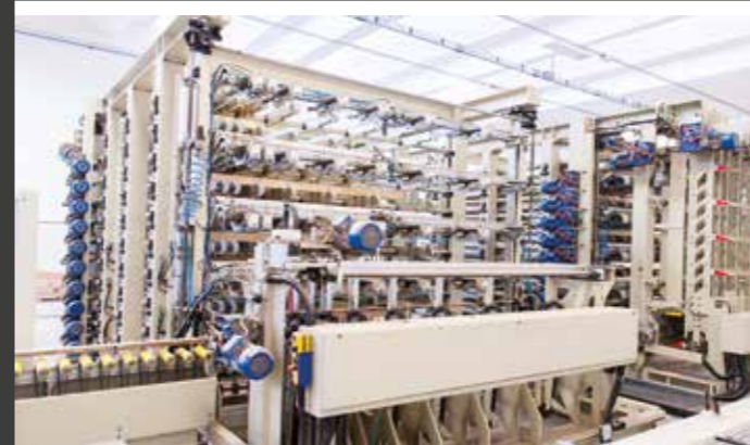
Linea di produzione a fase unica | Single stage production line