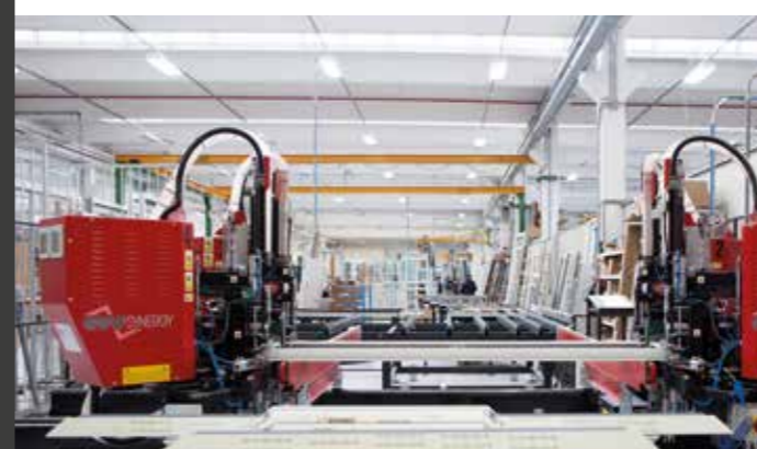
Reparto produzione PVC | PVC production department