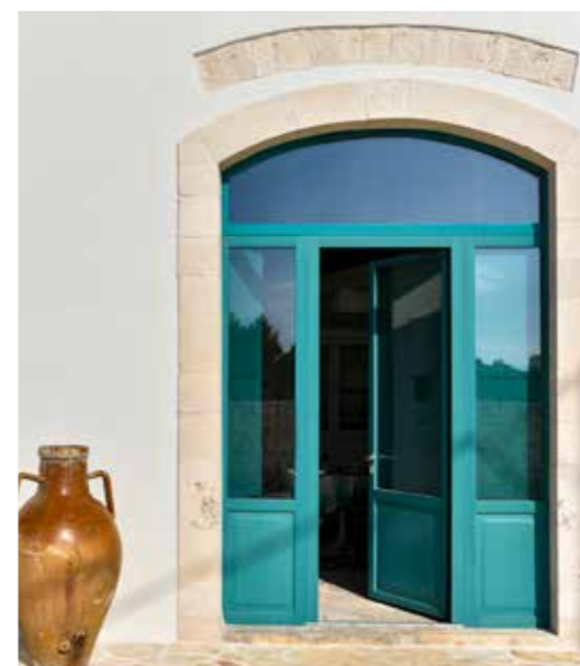
▲ Puglia - Masseria Borgo Aratico. Porta finestra TUTTO LEGNO Moderna con bugna inferiore Apulia - Masseria Borgo Aratico. Patio Door TUTTO LEGNO Moderna with lower ashlar

Frosinone - residenza privata. Studio di architettura Mimesi62. TUTTO LEGNO Classica 900 in pino lamellare smaltato RAL 9010. Frosinone - private residence. Mimesi62 architecture studio. TUTTO LEGNO Classica 900 in glazed laminated pine RAL 9010.