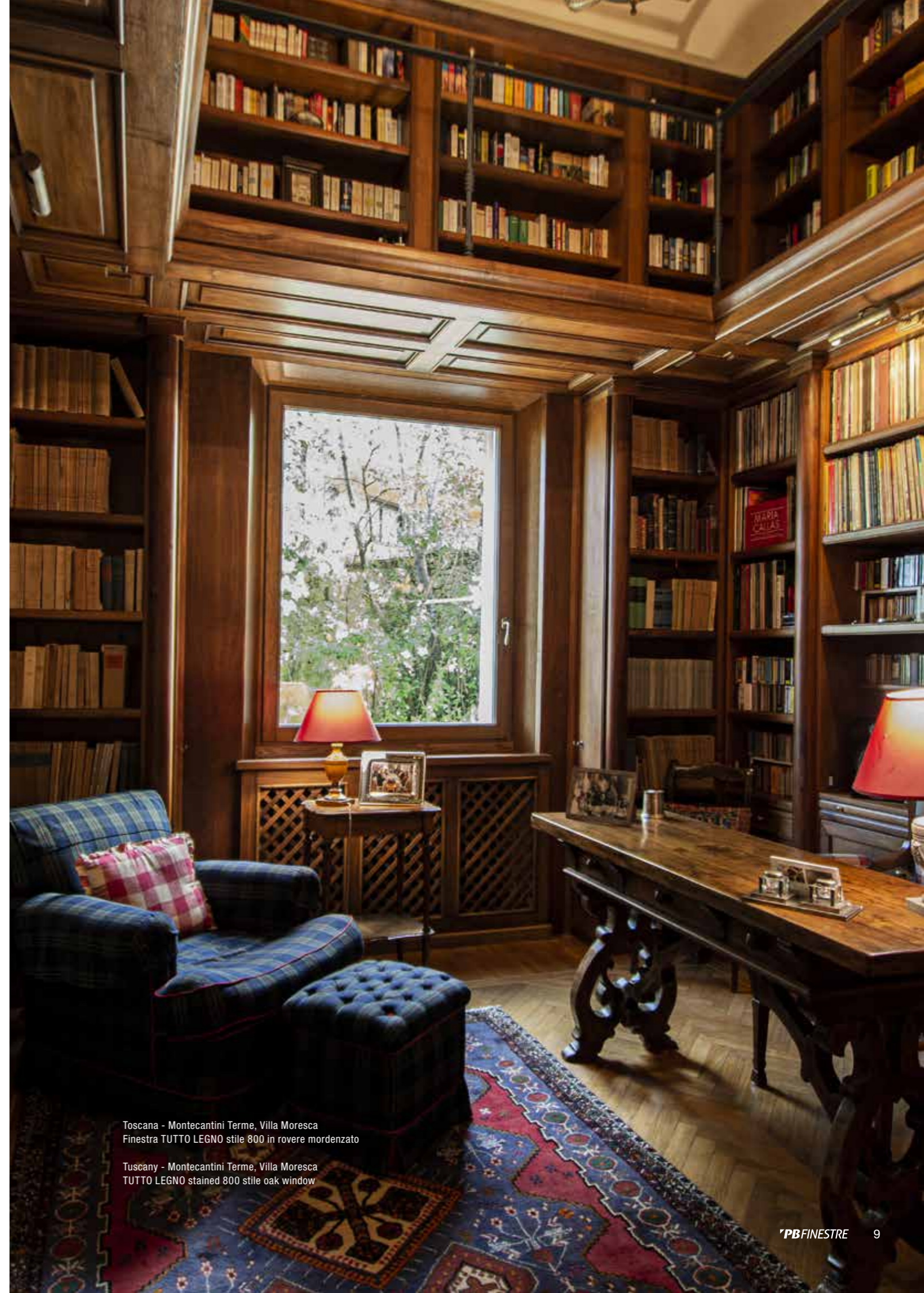
Toscana - Montecatini Terme, Villa Moresca Finestra TUTTO LEGNO stile 800 in rovere mordenzato