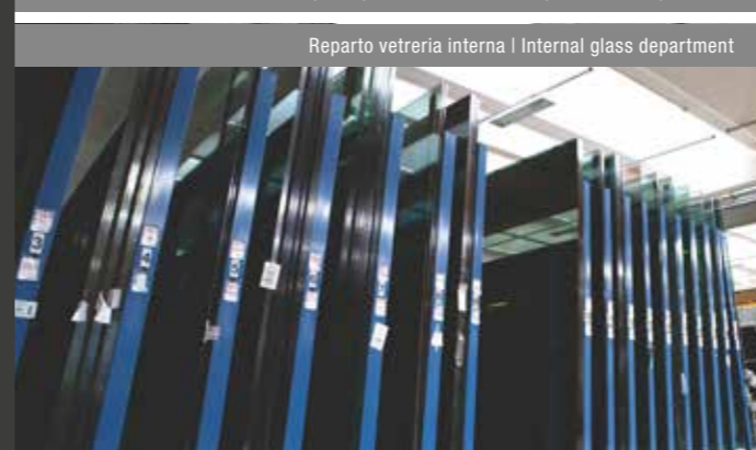
Reparto vetreria interna | Internal glass department