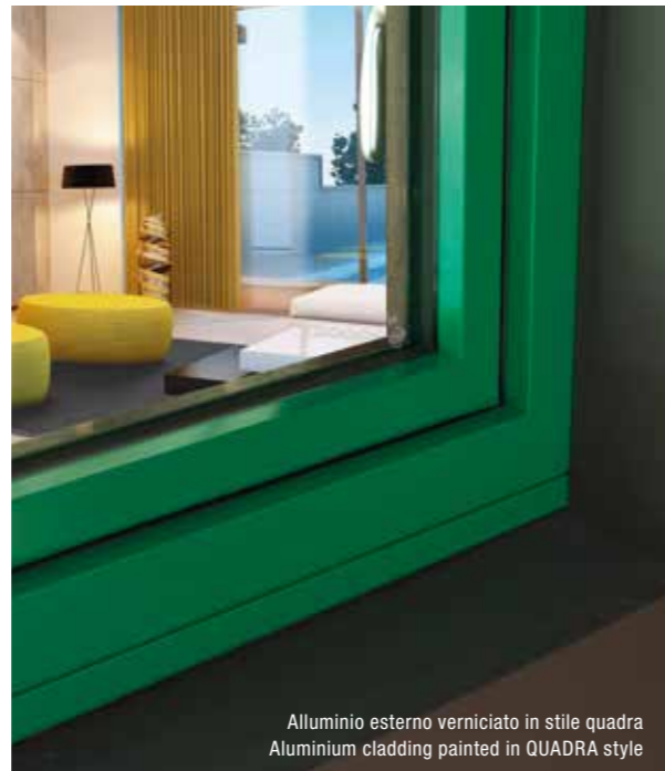
Alluminio esterno verniciato in stile quadra Aluminium cladding painted in QUADRA style