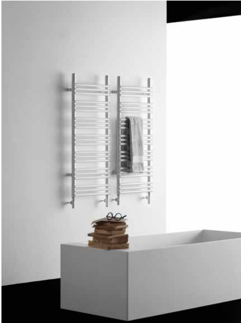
RABBIT 22 _ 105,2 x 43,5 cm _ COLOUR BCOR