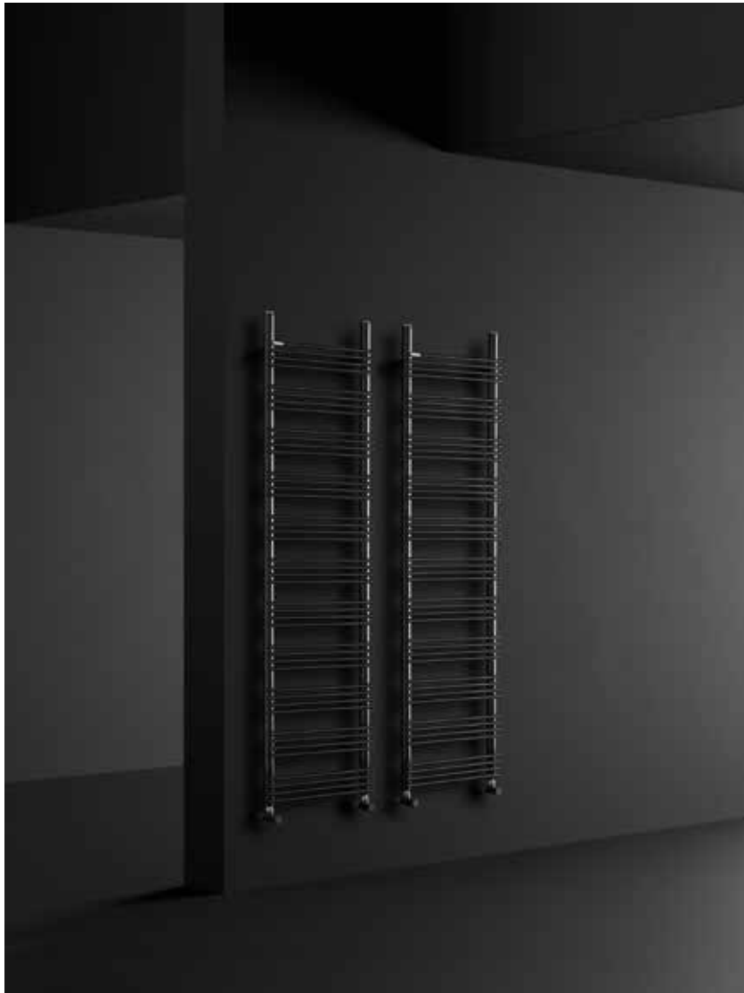
RABBIT 13 _162,8 X 43,5 cm _ COLOUR NEOP