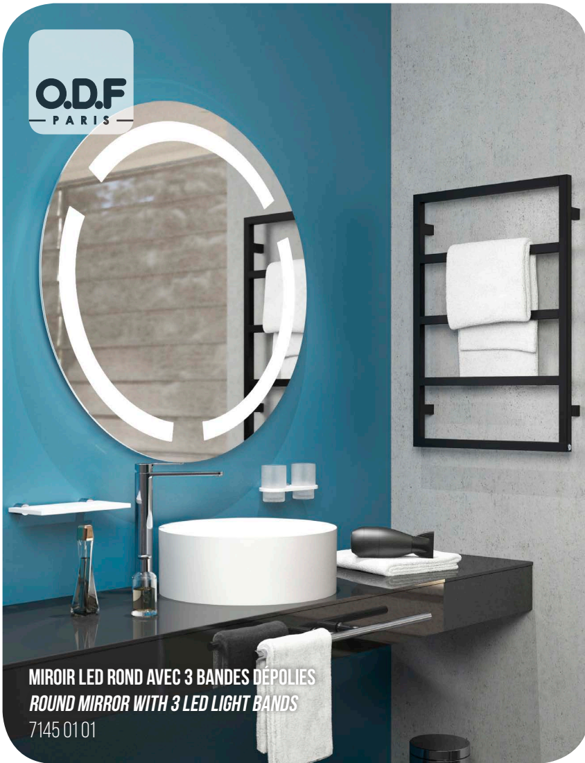
MIROIR LED ROND AVEC 3 BANDES DÉPOLIES ROUND MIRROR WITH 3 LED LIGHT BANDS 7145 0101