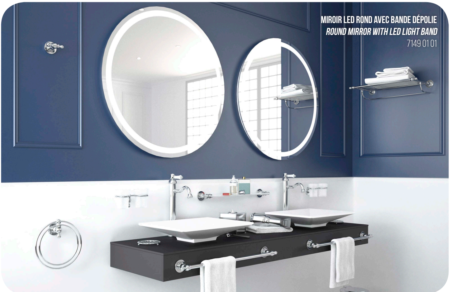
MIROIR LED ROND AVEC BANDE DÉPOLIE ROUND MIRROR WITH LED LIGHT BAND 7149 0101

With modern LED lighting and defogger device, our mirrors meet the demands of professionals of the hospitality sector. You'll find a large choice of mirrors with different light bands and frames. Discover a complete range by ODF of mirrors with integrated lighting designed for your bathroom.