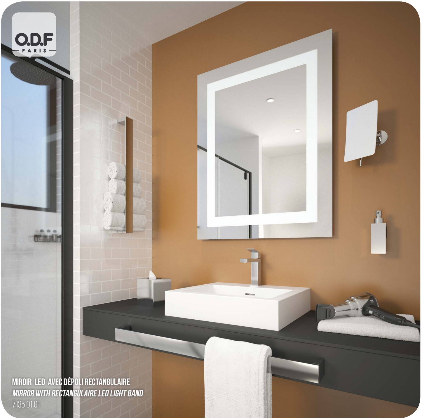
MIROIR LED AVEC DÉPOLI RECTANGULAIRE MIRROR WITH RECTANGULAIRE LED LIGHT BAND 7135 01 01