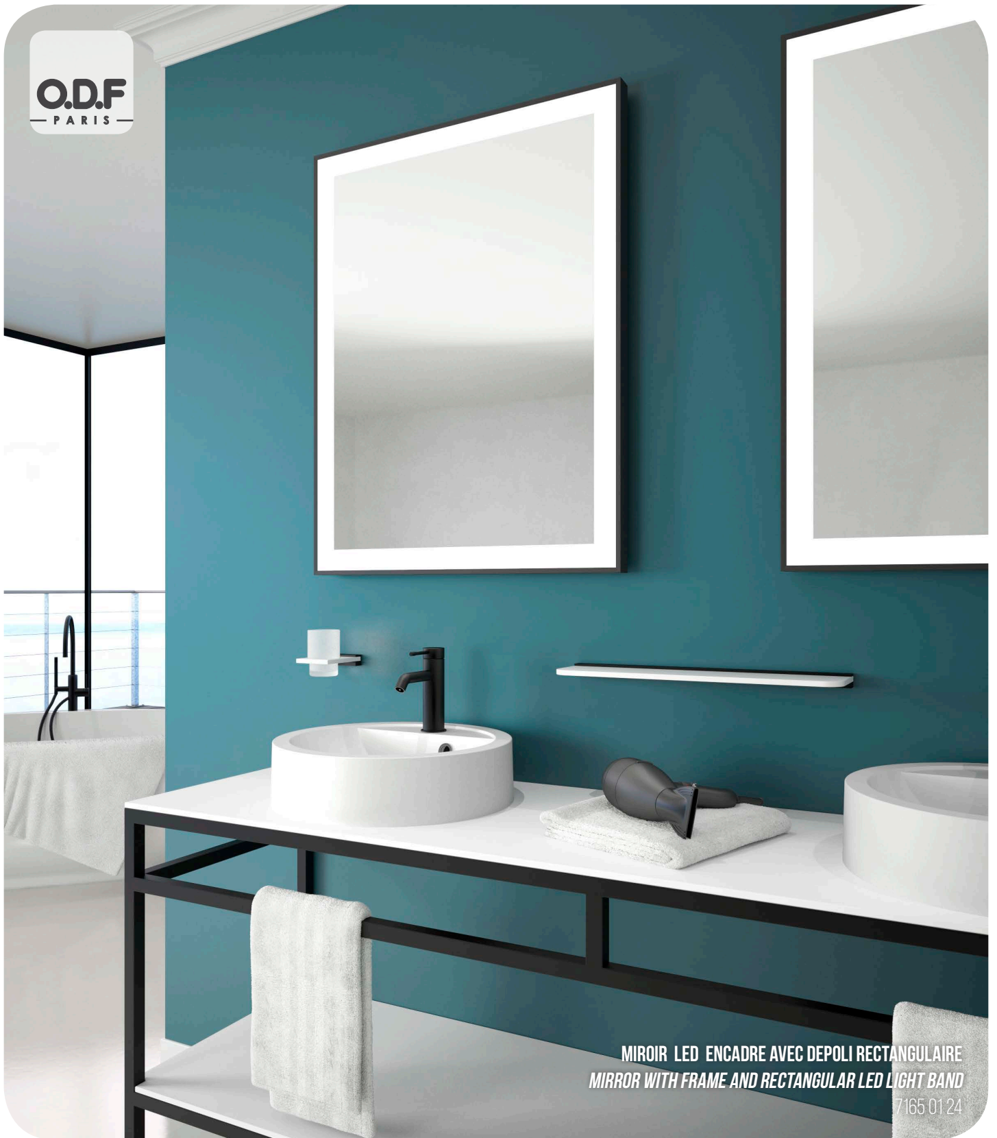
MIROIR LED ENCADRE AVEC DEPOLI RECTANGULAIRE MIRROR WITH FRAME AND RECTANGULAR LED LIGHT BAND 7165 01 24