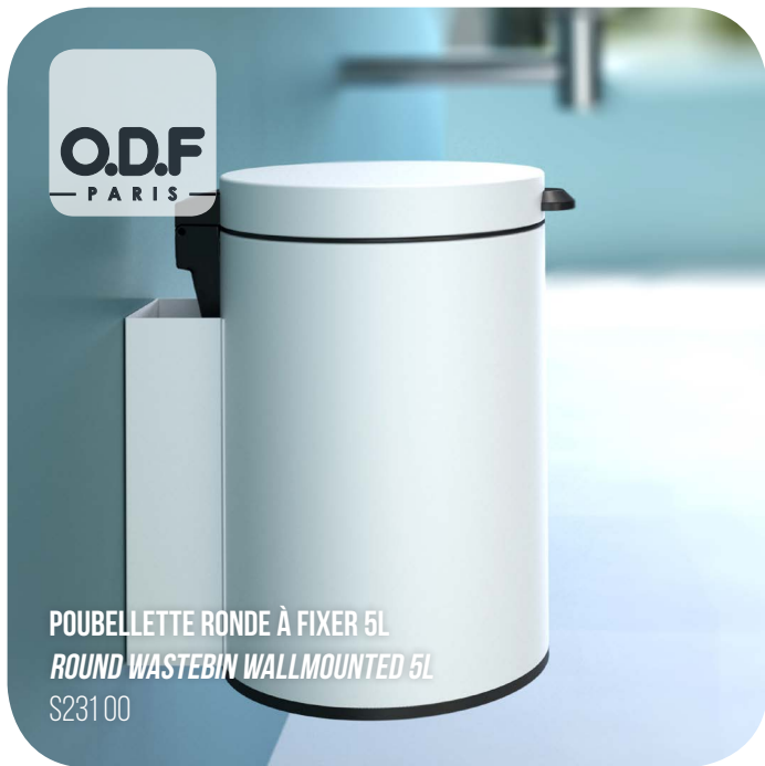
POUBELLETTE RONDE À FIXER 5L ROUND WASTEBIN WALLMOUNTED 5L S231 00