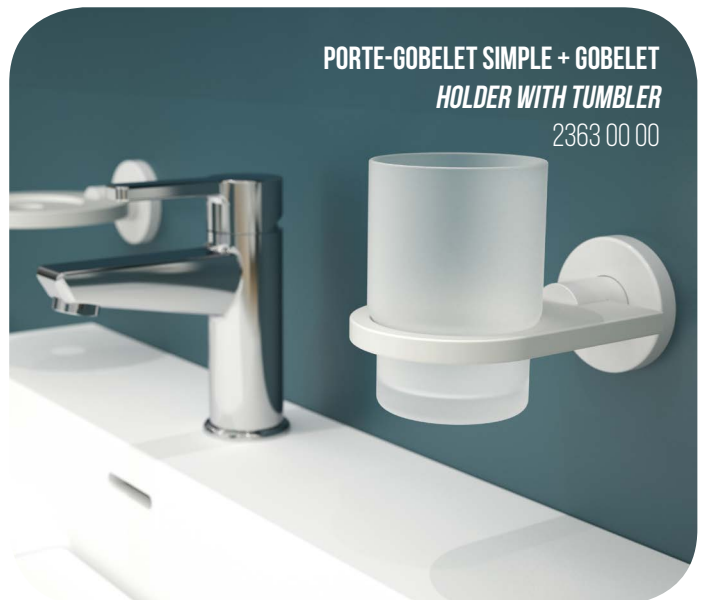
PORTE-GOBELET SIMPLE + GOBELET HOLDER WITH TUMBLER 2363 00 00

More than 12 ranges of bathroom accessories with a large choice of finishes : chrome, matt black, white, supreme gold, timeless rust...