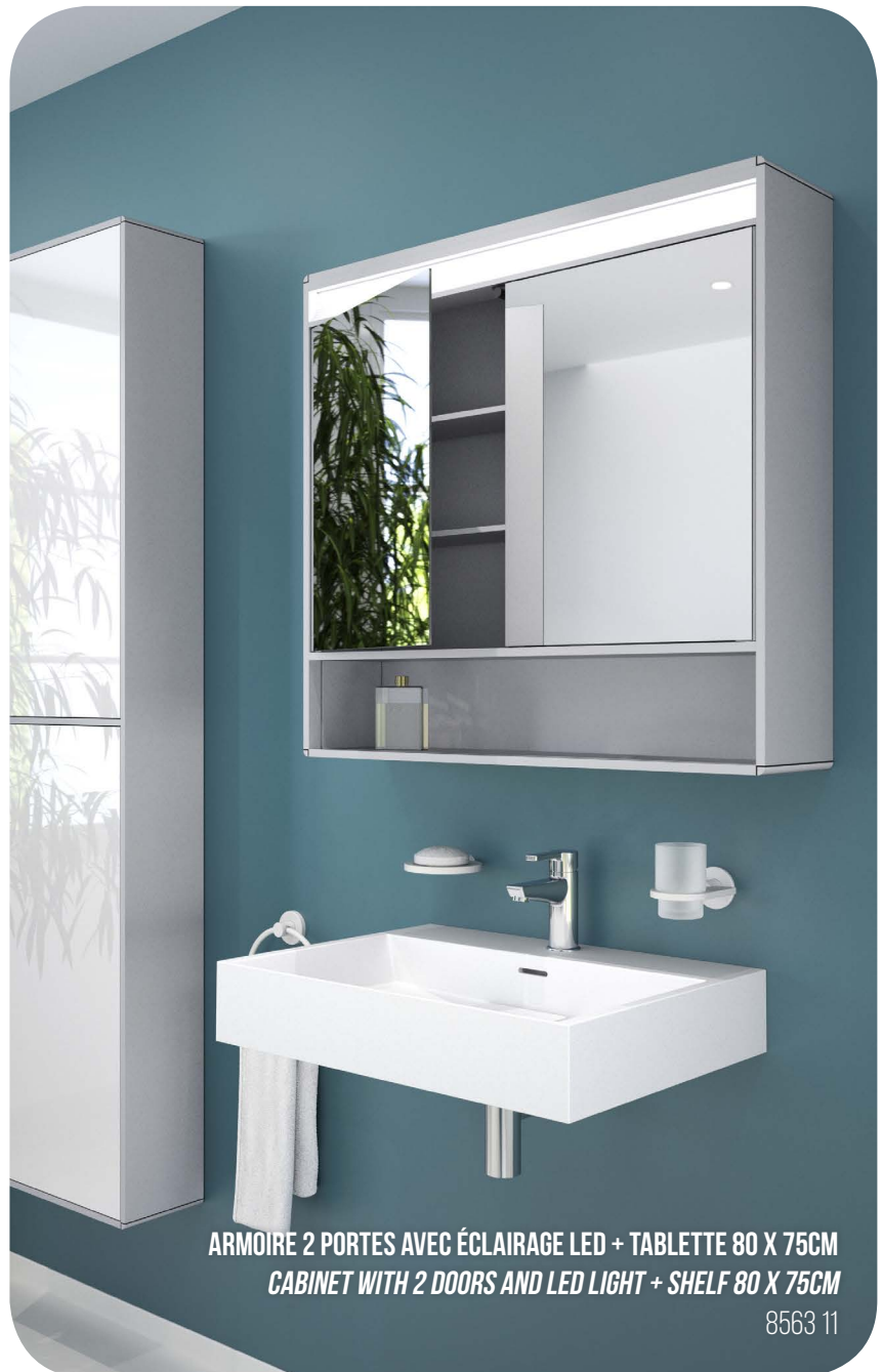
ARMOIRE 2 PORTES AVEC ÉCLAIRAGE LED + TABLETTE 80 X 75CM CABINET WITH 2 DOORS AND LED LIGHT + SHELF 80 X 75CM

Provided with LED lighting and non-breaking mirror doors, they increase the comfort in your hotel room.