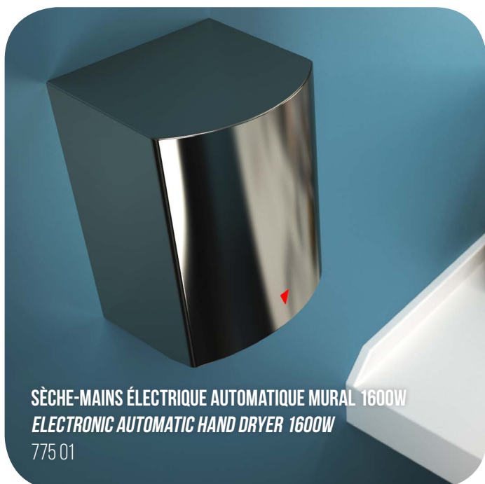
SÈCHE-MAINS ÉLECTRIQUE AUTOMATIQUE MURAL 1600W ELECTRONIC AUTOMATIC HAND DRYER 1600W 775 01