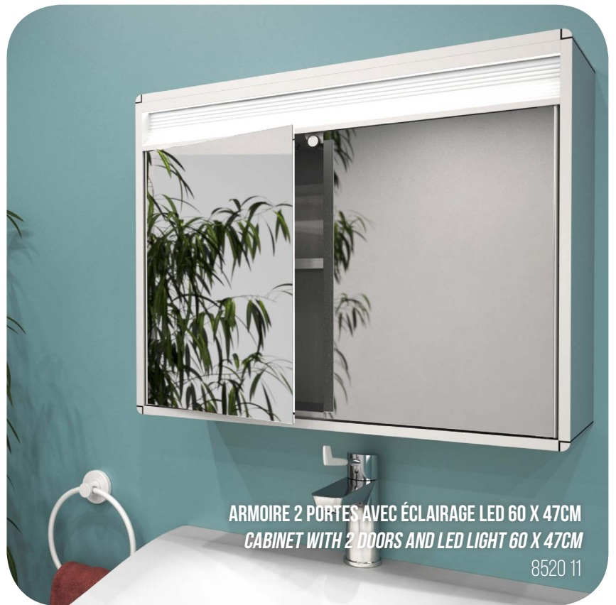
ARMOIRE 2 PORTES AVEC ÉCLAIRAGE LED 60 X 47CM CABINET WITH 2 DOORS AND LED LIGHT 60 X 47CM

In standard or customised dimensions, our cabinets are equipped with or without integrated low energy LED lighting.