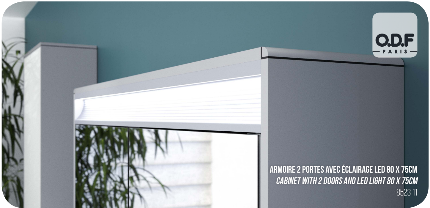
ARMOIRE 2 PORTES AVEC ÉCLAIRAGE LED 80 X 75CM CABINET WITH 2 DOORS AND LED LIGHT 80 X 75CM