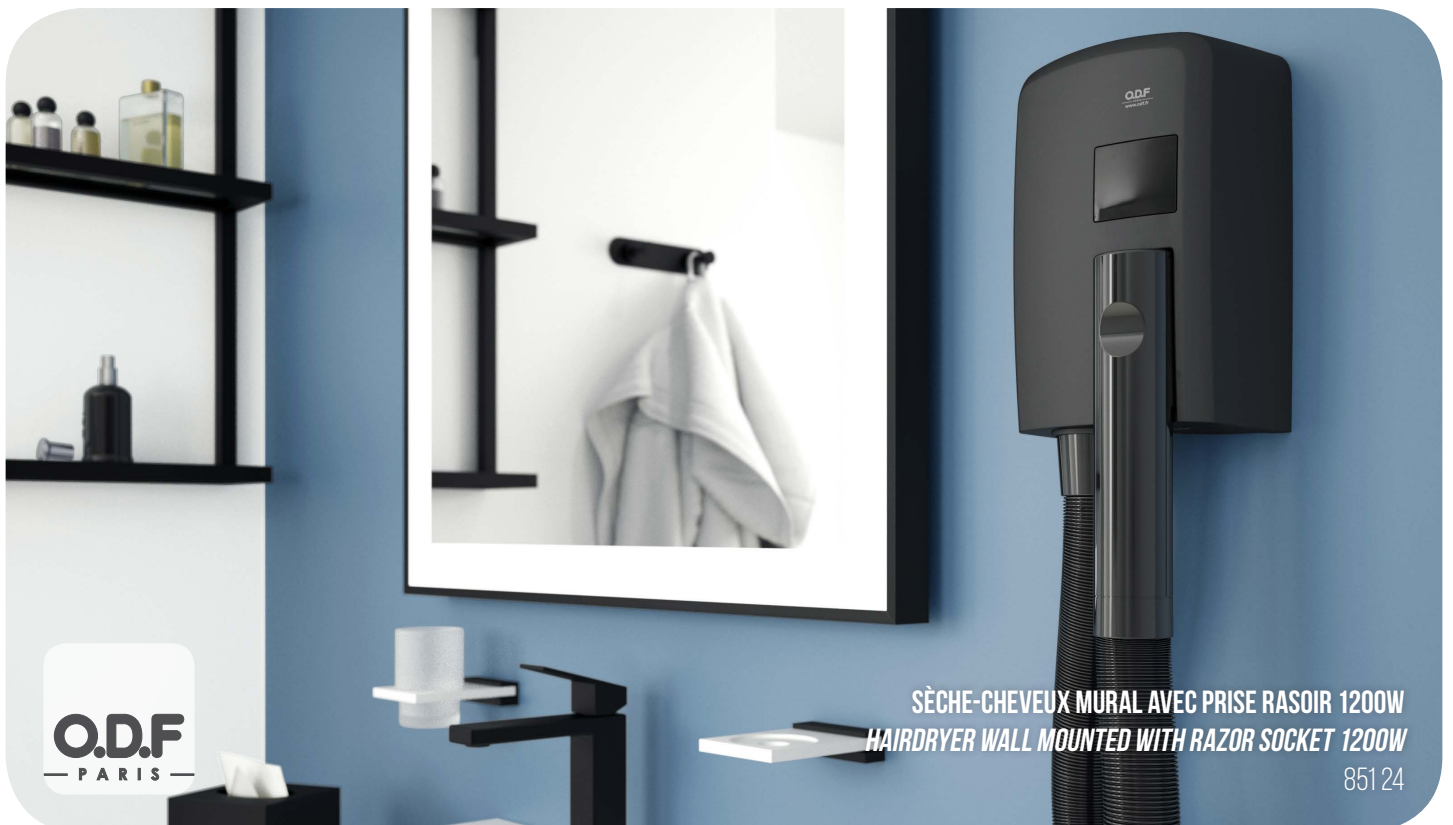
SÈCHE-CHEVEUX MURAL AVEC PRISE RASOIR 1200W HAIRDRYER WALL MOUNTED WITH RAZOR SOCKET 1200W