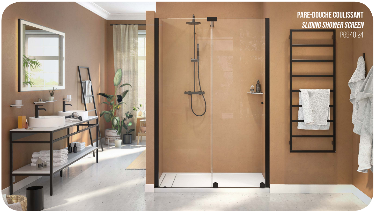
PARE-DOUCHE COULISSANT SLIDING SHOWER SCREEN PG940 24