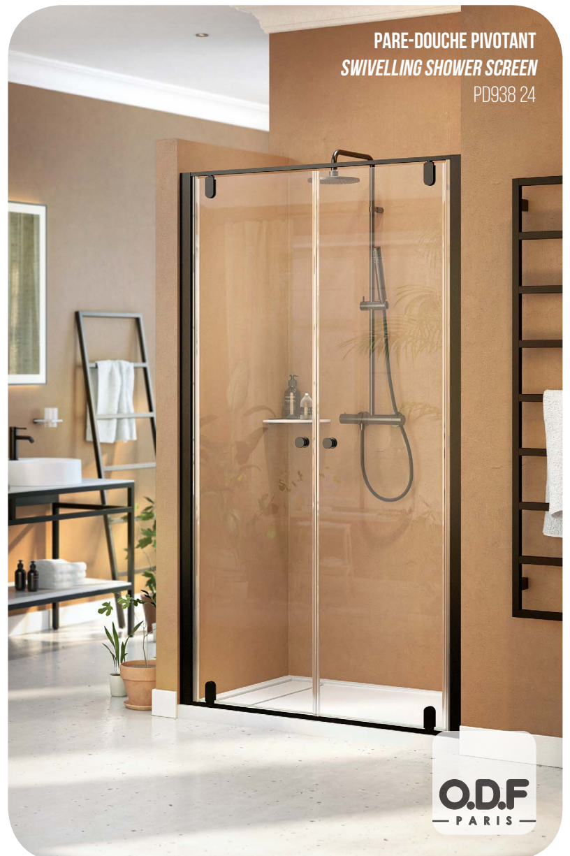
PARE-DOUCHE PIVOTANT SWIVELLING SHOWER SCREEN PD938 24