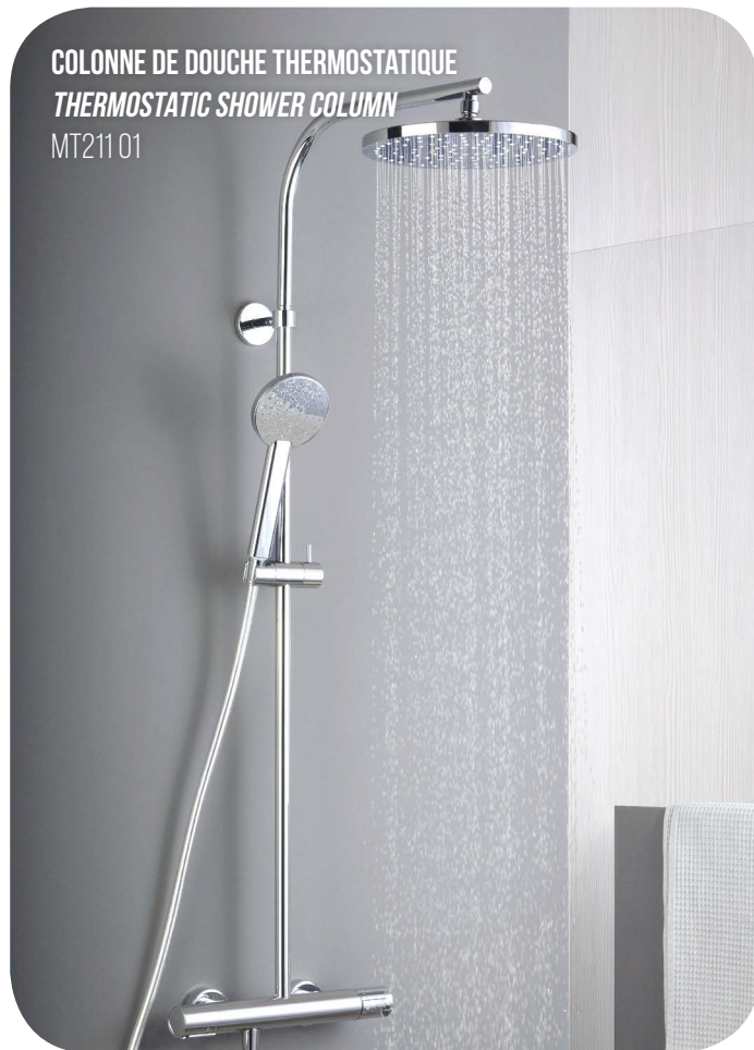
COLONNE DE DOUCHE THERMOSTATIQUE THERMOSTATIC SHOWER COLUMN MT211 01