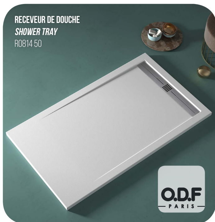
RECEVEUR DE DOUCHE SHOWER TRAY R0814 50