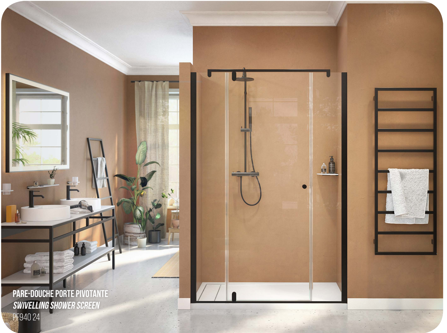
PARE-DOUCHE PORTE PIVOTANTE SWIVELLING SHOWER SCREEN

Avec ou sans panneau fixe Optionally with fixed panel