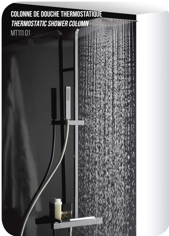
COLONNE DE DOUCHE THERMOSTATIQUE THERMOSTATIC SHOWER COLUMN MT111 01