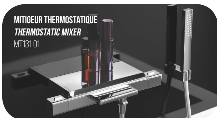
MITIGEUR THERMOSTATIQUE THERMOSTATIC MIXER MT131 01

38°C de bien-être en toute sécurité et une haute qualité de robinetterie au service du confort de l'utilisateur et du respect de la planète / 38 ° C of well-being in complete safety with a high quality of fittings at the service of user comfort and respect for the planet.