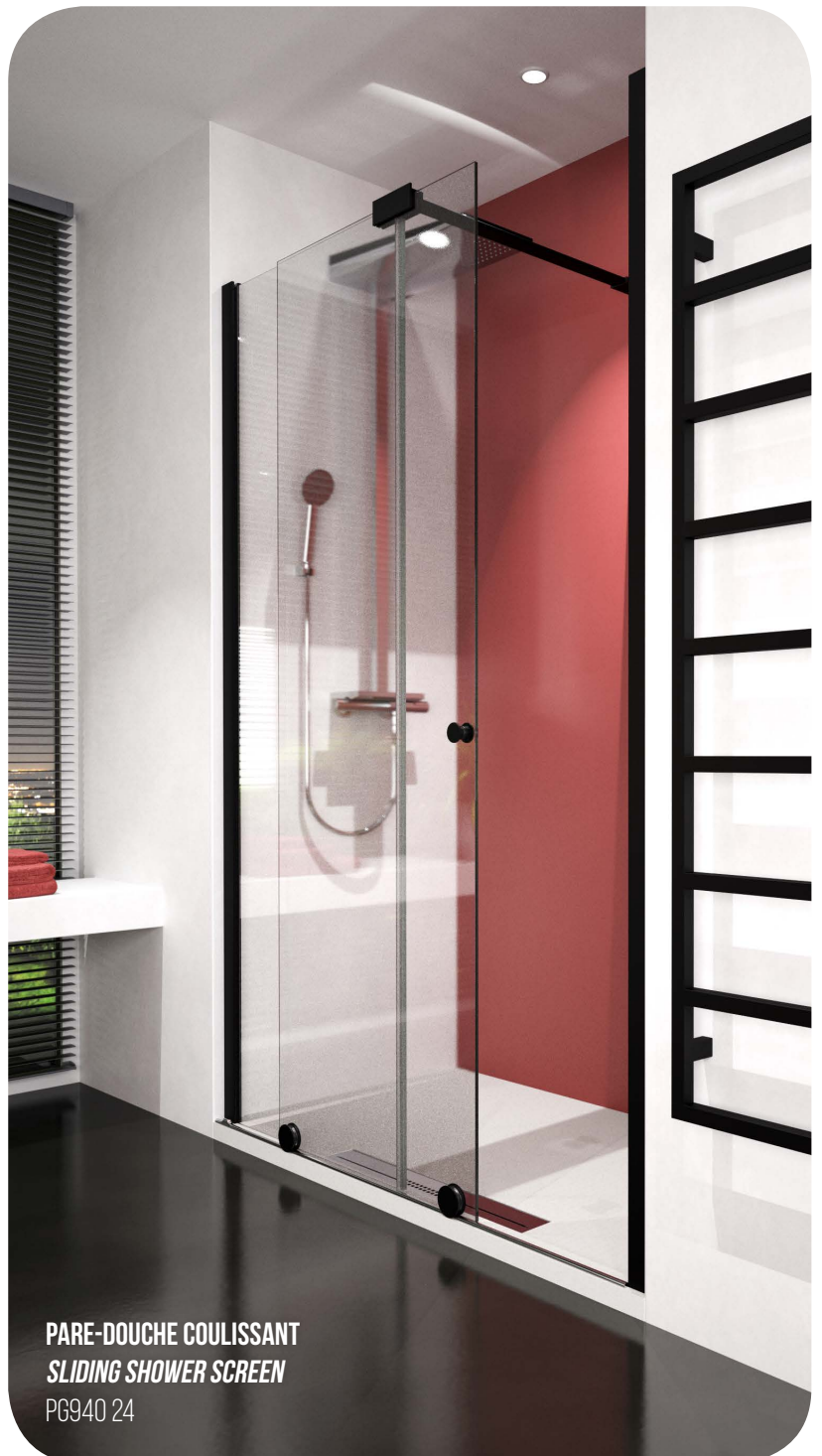
PARE-DOUCHE COULISSANT SLIDING SHOWER SCREEN PG940 24